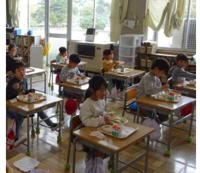
1年生：小学校で初めての給食です。

保護者の皆様・地域の皆様、本校児童の健全育成のために共に手を携えていただけますよう、御理解と御協力をよろしくお願いいたします。