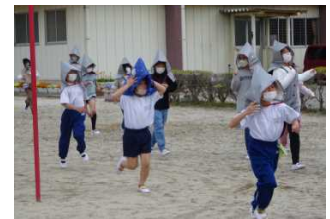
校庭に避難する児童

また、校庭へ避難するよう指示が出されると、無言でスムーズに指示された場所に整列することができました。1年生も慌てることなくしっかりと行動できており、大変立派でした。