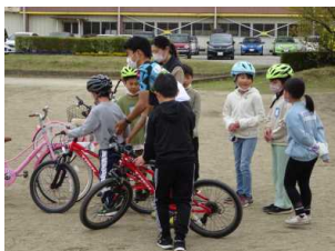
那須ブルーゼンの選手による安全教室

18日には、那須ブルーゼンの選手による「自転車安全教室」(3年生対象)を行いました。前半は講話、後半は実技の二本立てでしたが、児童は真剣に選手の話に耳を傾け、実技にも意欲的に取り組んでいました。