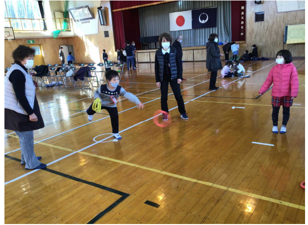
皆さん、なかなかの腕前でした

1・2年生が、高久地区社協会員や祖父母の方々と交流する、生活科の授業を行いました。当日は、3密を避けながらグループに分かれて、「輪投げ」をして遊びました。また、日頃の子どもの活動の様子も、映像で紹介させていただきました。短い時間でしたが、楽しく交流できました。