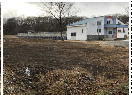
駐車場としての活用を想定