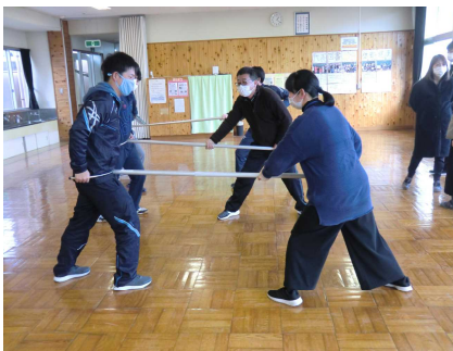
教職員のさすまた訓練