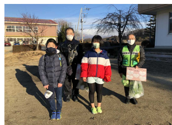
交通指導員さんと

児童会主催で、2月10日に感謝の会を行う計画を立てました。日頃からお世話になっている、調理員さん、交通指導員さん、読み聞かせボランティアの方々などに、感謝の気持ちを伝える手紙を書きました。計画では、皆様に来校いただいて体育館で実施する予定でしたが、コロナ禍の下、感染拡大防止に配慮して、代表の子どもたちが機会を見つけて手紙と鉢花を贈り、感謝の気持ちを伝えました。