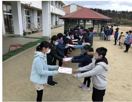
在校生からの色紙の贈呈

卒業を控えた6年生へ、今までお世話になった感謝の気持ちと卒業のお祝いの気持ちを伝えようと、4・5年生の実行委員が中心となって、卒業生を送る会を行いました。下校時に中庭で、在校生から卒業生一人一人に寄せ書きと鉢花が贈られました。今後、卒業式までの間に、「6年生と遊ぼう」と題して、昼休みに各学年ごとに6年生と遊ぶイベントが行われます。楽しく遊んで、思い出づくりの時間にして欲しいと思います。校庭や中庭から、6年生と在校生の歓声が聞こえてきそうです。