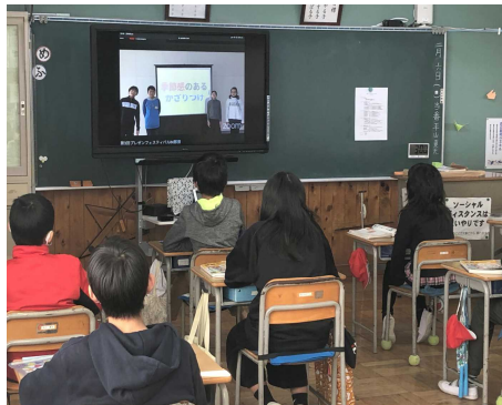
他校のプレゼンも視聴

本校からは、5・6年生のグループが参加し、素晴らしい発表をしました。下野新聞社が取材に訪れ、当日の視聴の様子が翌日の新聞で紹介されました。