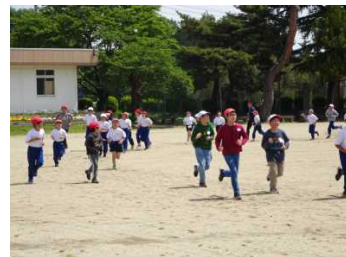
全校児童による5分間走

全体会の折にもお話をしましたが、今年度の本校のキーワードは、「自律」と「チーム学校」です。全教職員が一丸となって、児童に自律を促す教育活動を行って参りますので、今後とも御理解と御協力をお願いします。