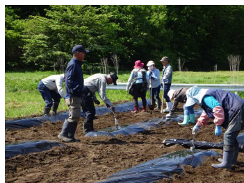
ボランティアの方々による事前準備

ボランティアの皆様には、前日から当日の朝にかけて事前準備を行ってくださり、また、児童、園児に丁寧に御指導くださりありがとうございました。秋の収穫が楽しみです。