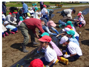
説明を聞きながら植えています