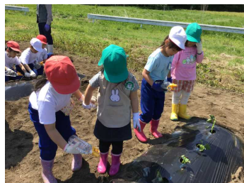
保育園のお友達とも仲よくできました