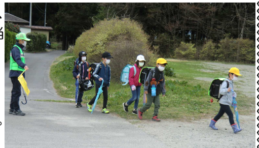
スクールバス駐車場付近の横断

さらに、那須町独自の教科NAiSUタイムでは、18日に緊急地震速報を使っての避難訓練を実施しました。子どもたちは、教室の机の下に潜ると、机の脚をしっかりと握って揺れで机が動かないように固定していました。折しも、次の日の19日には、本当の緊急地震速報が流れました。子どもたちは、前日と同じように自分の身を守る行動ができていました。1年生も慌てることなくしっかりと行動できており、大変立派でした。