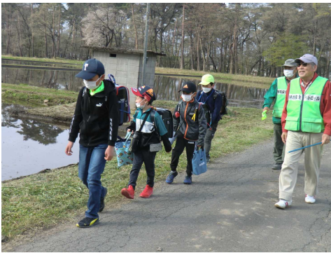
新高久方面からの登校

今年度も、交通指導員や地域の安全ボランティアの方々には、毎朝子どもたちの安全に気を配っていただいております。本当