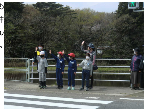
4/20 交通安全教室での横断練習

高久小ホームページ https://takaku.edumap.jp QRコード → カラーでご覧になれますので、アクセスしてみてください。4/25現在、アクセス数が62,900を超えました。