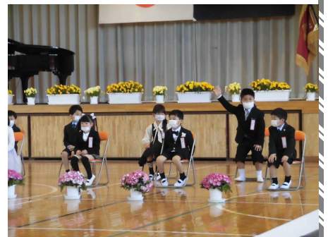
〈元気な1年生が入学しました！〉

子どもたちには何かあったときに、いつも先生や親など大人からの指示を待つのではなく、自分で考え自己決定する力を身に付けてほしいと思います。これからも、学校と御家庭とが協力して子どもたちを育てていけますよう、よろしくお願いいたします。