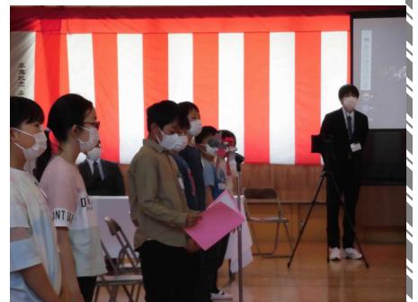
〈歓迎のあいさつをする6年生〉 入学式の様子