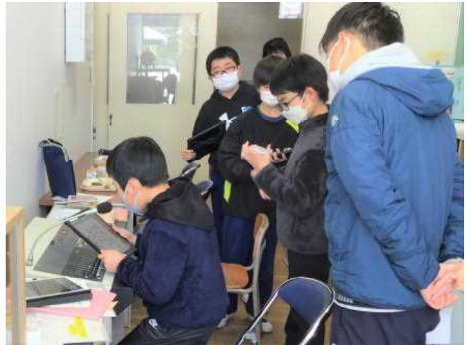
クラス目標を発表する代表児童

全てのクラスが、その学年の発達段階にあった具体的な目標を立てて、取り組む努力をしていると思います。教室の背面黒板などにそれぞれの学年で掲示していますので、授業参観の際に御覧ください。