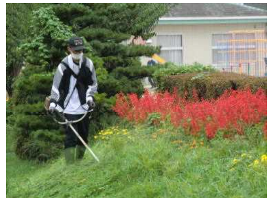
PTA奉仕作業での草刈り

さらに、8月27日には、第2回PTA奉仕作業が行われ、事業部の方をはじめ教職員含め56名での作業となりました。校庭の除草、学校敷地周り、生け垣や農園など、見違えるほどきれいになりました。子どもたちは、きれいな環境で学校生活を送ることができます。ありがとうございました。