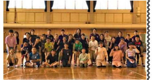
6年生 親子ミニ運動会

2年生は、町子育て支援センターの方が講師となって、親子で「歯科保健教室」を部会行事として行いました。その後、親学習プログラム「子どものいいところを伸ばそう」のワークショップを行いました。6年生は体育館でミニ運動会を行いました。親子のよい時間を作れたようです。