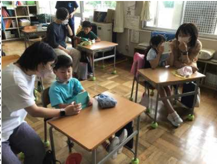
2年生 歯みがき指導

2年生は、町子育て支援センターの方が講師となって、親子で「歯科保健教室」を部会行事として行いました。その後、親学習プログラム「子どものいいところを伸ばそう」のワークショップを行いました。6年生は体育館でミニ運動会を行いました。親子のよい時間を作れたようです。