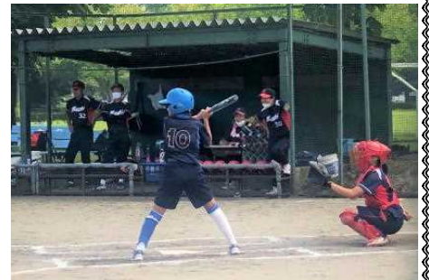
学びの森SBCとの対戦

ソフト部・野球部の皆さん、良い試合を見せてくれてありがとう！6年生、お疲れ様でした。