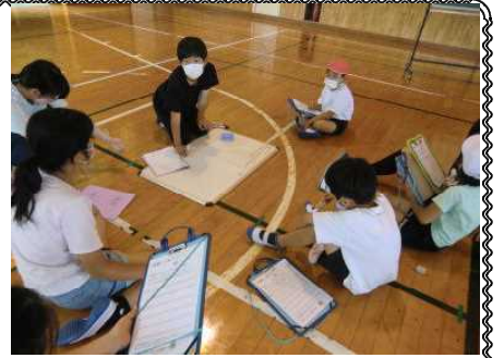
話し合いをする子どもたち

今年度、第1回目の全校道徳を行いました。昨年までは各教室で芭蕉っ子（縦割り）班毎に行っていましたが、今年度は体育館に全校児童が集まりました。平山教諭から全体にテーマ「いじめについて」の投げかけがあった後は、班ごとに1～6年生が考えを話し合い、ホワイトボードにまとめました。意見の交流は全体で行い、次の全校道徳につながる授業となりました。