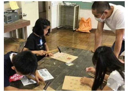
真剣に釘を打つ3年生