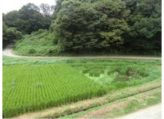
8月下旬の芭蕉っ子田んぼの様子

夏休み明け集会で久しぶりに会った子どもたちの姿は、身長が伸び体が一回り大きくなったようで、頼もしさと嬉しさを感じました。家族の方との充実した時間を過ごし、心身ともに成長して学校に戻ってきたのではないかと思います。