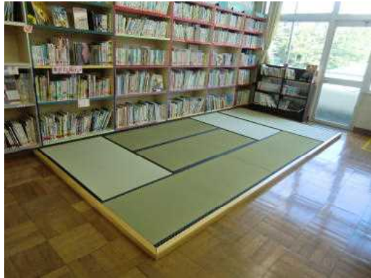
図書室のくつろぎコーナー