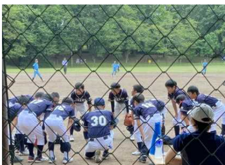
円陣を組み、士気を高めます！

7月30日（土）31日（日）に、那須野が原ライオンズ杯争奪小学生女子ソフトボール大会が行われました。熱戦を繰り広げ、公式戦の勝利をつかみました。たった一人の6年生のキャプテンを盛り上げる3～5年生、部員11名全員で勝ち取った勝利は、素晴らしい価値のあるものでした。